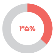
کیفیت پایین فیلم‌ها؛ علت سینما نرفتن