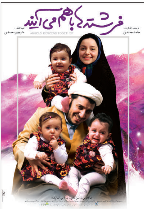
فرشته‌ها با هم می‌آیند / کارگردان: حامد محمدی محصول: سازمان سینمایی سوره / پخش: موسسه بهمن سبز (طراح پوستر: بهزاد خورشیدی)