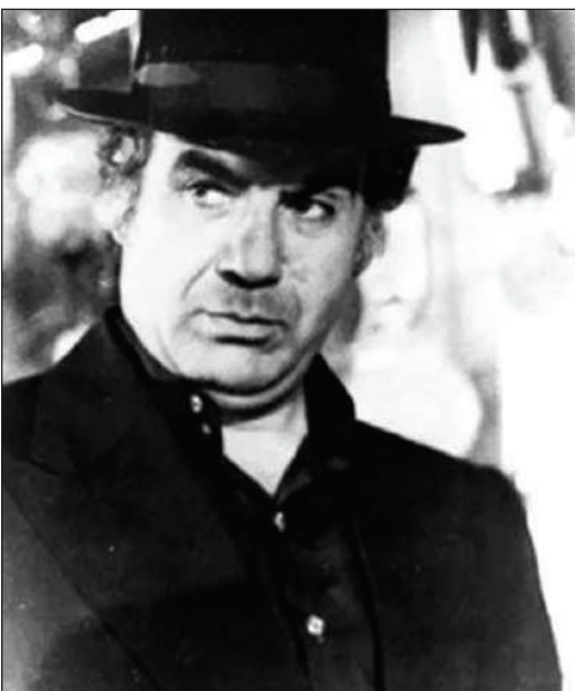
نمایی از فیلم «قیصر» (مسعود کیمیایی) پرفروش‌ترین فیلم سال ۱۳۴۸

در روز دوم اربهشت‌ماه ۱۳۰۷ علینقی وزیری موسیقی‌دان بزرگ ایران و خان‌بابا معصدی، سالن سینمایی را با نام «صنعتی» در محل مدرسه عالی موسیقی در خیابان لاله‌زار تهران افتتاح کردند. این سینما که کار خود را با فیلم سیاه‌آغاز کرد مخصوص خانم‌ها بود.